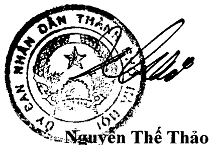
Nguyễn Thế Thảo